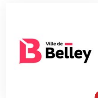
Utiliser une couleur en dehors de celles dans la charte