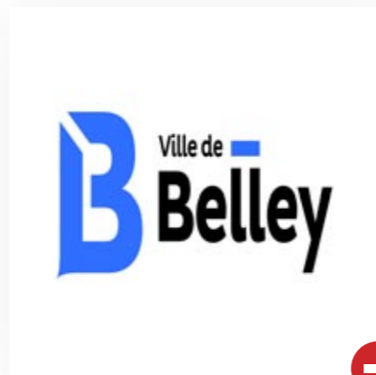
Déformation du logo