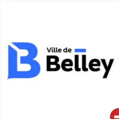
Non respect de la zone de protection