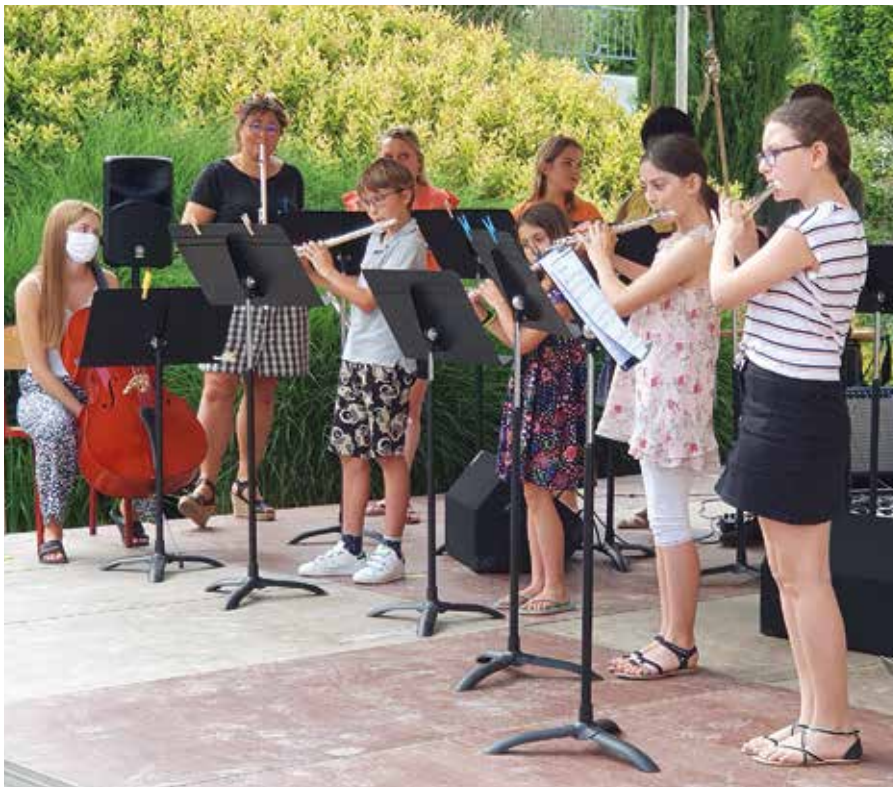
Fête de la musique 2021 (photo d'archives).

Une réunion a eu lieu en fin d'année 2021, la dynamique est enclenchée, des objectifs ont été définis pour l'année 2022.