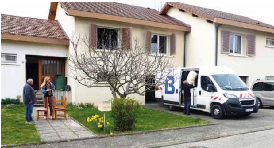
Deux maisons CNR ont été équipées pour accueillir des familles ukrainiennes dans les meilleures conditions.

Deux maisons mises à disposition par la CNR ont été aménagées et équipées cette semaine pour recevoir prochainement des familles ukrainiennes. Meubles et électroménager donnés par des particuliers ont été collectés par les bénévoles de l'association SIAFM au sein d'un local à Ugiparc. La Ville de Belley a assuré la coordination, la mise en relation et le transport du mobilier.