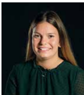
Estelle Mellet Multi-accueil Bulle d'éveil