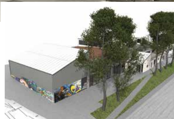
Les travaux de réfection de la Halle Gonnet devraient s'achever avant la rentrée scolaire.