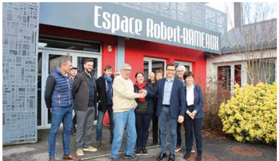
Les représentants de l'association Obatala et de la Ville de Belley à l'occasion de la signature de la convention le 19 janvier.

L'association Obatala a pris possession des lieux dès la signature du contrat le 19 janvier. « Nous avons fait le choix de candidater à la DSP de l'Espace Robert-Rameaux car cette démarche s'inscrit dans notre volonté de pérenniser nos actions sur le territoire et de mettre en valeur les artistes