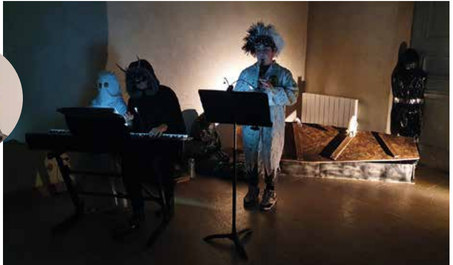
Le Scary musical tour a réuni une centaine de personnes au palais épiscopal.

► + d'infos : conservatoire@belley.fr tél. 04 79 42 27 22 - Facebook