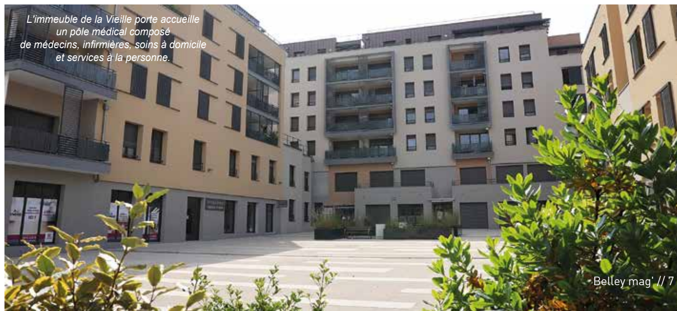
L'immeuble de la Vieille porte accueille un pôle médical composé de médecins, infirmières, soins à domicile et services à la personne.