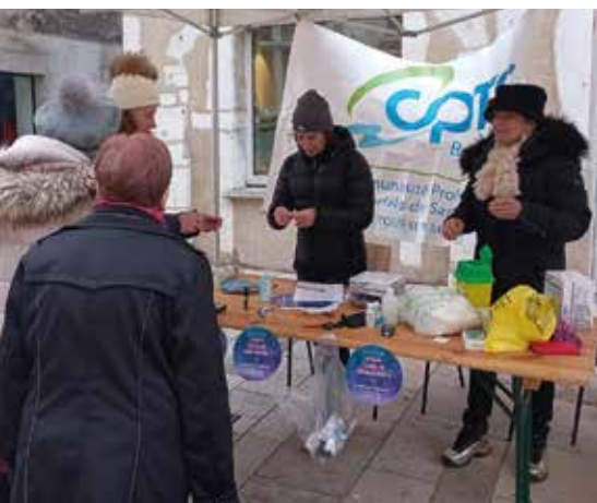
Campagne de dépistage du diabète sur le marché hebdomadaire, en collaboration avec la Ville de Belley.

Nous envisageons d'abord d'interroger les professionnels de santé du territoire pour recueillir leur ressenti et savoir ce qu'ils aimeraient qu'on développe. Il y a sûrement un sujet vis-à-vis du cancer et de l'après-cancer, vis-à-vis de la personne âgée et notamment du repérage de la fragilité à domicile. Il y a des tas de sujets de santé différents sur lesquels nous aimerions travailler comme ceux en lien avec les enfants, car c'est notre avenir. Si un enfant démarre bien dans la vie et en bonne santé, il saura aussi mieux s'insérer socialement au sein de notre territoire.