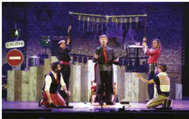
Les Fo'Plafonds et leur concert 100% tubes recyclés se produiront le 17 octobre à L'Intégral.