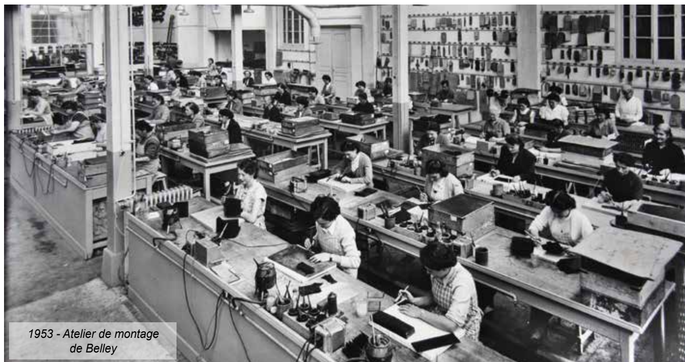
1953 - Atelier de montage de Belley